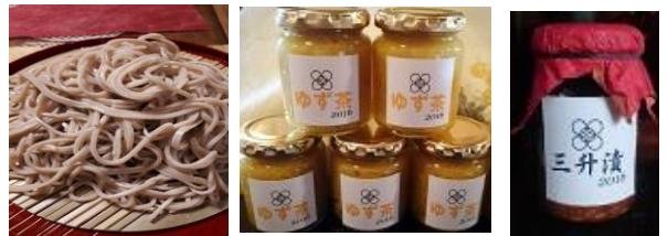
こころみ自家製発酵食品、ジャムなどの店頭販売もあります！