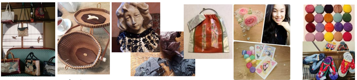
※写真は、すべてイメージです。