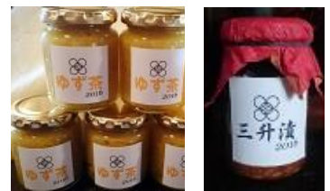
自家製発酵食品、ジャムなどの店頭販売もあります！