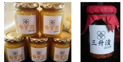
こころみ自家製発酵食品、ジャムなどの店頭販売