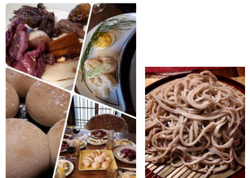
画像はあくまでイメージです。